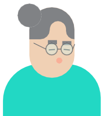
las lentes correctores

Hay medidas sencillas y económicas para hacer frente sin dificultad a los problemas sensoriales, como: